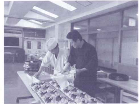
安曇野市穂高飲食店組合 寿司慰問

寿司慰問 安曇野市穂高飲食店組合 野菜・花 豊科 新田子ども会育成協議会 通年奉仕団体等 理容師組合穂高部会