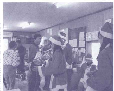
東京電力労働組合松本総支部

十一月 珈琲 三郷 安曇野珈琲工房 古布 松本市 中島寝具仕立所 菓子 豊科 チェリーベーカリー もち米 三郷 よろずや松岡商店 野菜 松本市 川村誠