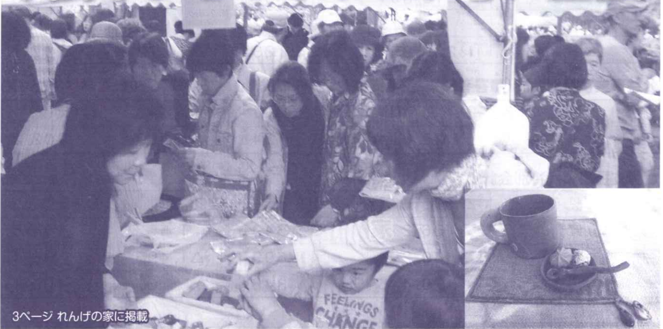
3ページ れんげの家に掲載