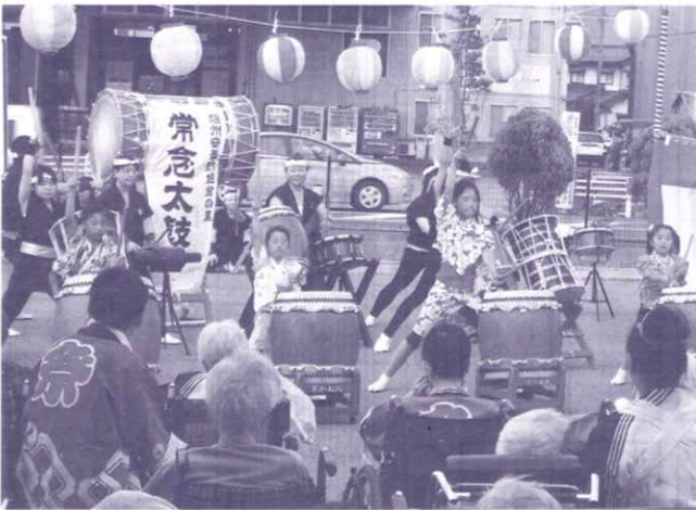
夏空に響く太鼓の演奏

祭りの後半は、「堀金常念太鼓」の演奏があり、子どもが無邪気に楽しく打つ太鼓に愛くるしさを感じ、保存会は、大人の迫力ある勇壮なばちさばきと、身体の底から響いてくる鼓動が、会場全体に伝わっていききました。太鼓の音が、感動とともにいつまでも心に響きわたる余韻の中、夏祭りが閉会しました。