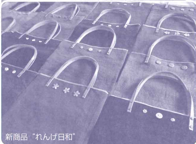
新商品 “れんげ日和”