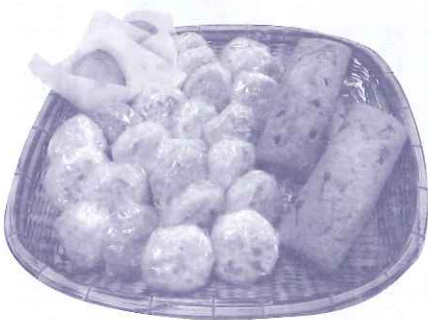
おやき・バターケーキ